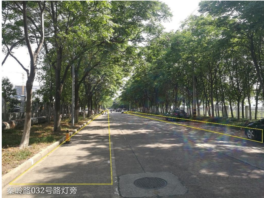
图 2-2 秦岭路 032 号路灯旁道路两侧禁止停车区域抓拍区域

（四）路口监控点位踏勘参照新建违停抓拍点位样例；不礼让行人抓拍、电子哨兵点位踏勘参照高清人车卡口点位样例；炸街车抓拍、右转必停点位踏勘参照高清电子警察点位样例。