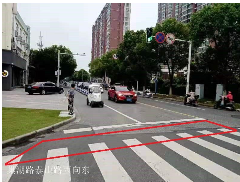
图 1-4 巢湖路泰山路西向东混合车道及非机动车道抓拍区域