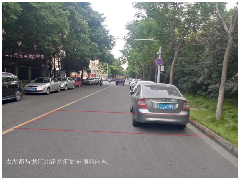
图 1-2 太湖路与龙江北路交汇处东侧西向东机动车道及非机动车道抓拍区域