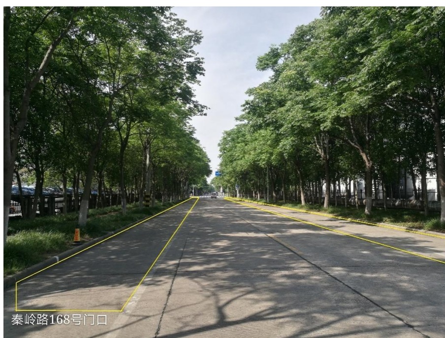
图 1-2 秦岭路 168 号门口道路两侧禁止停车区域抓拍区域