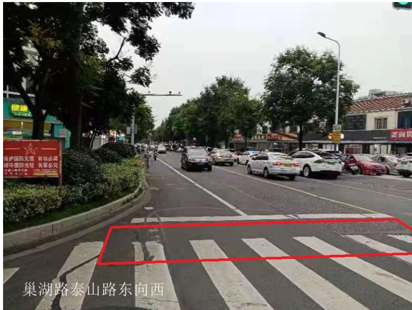
图 1-3 巢湖路泰山路东向西混合车道及非机动车道抓拍区域