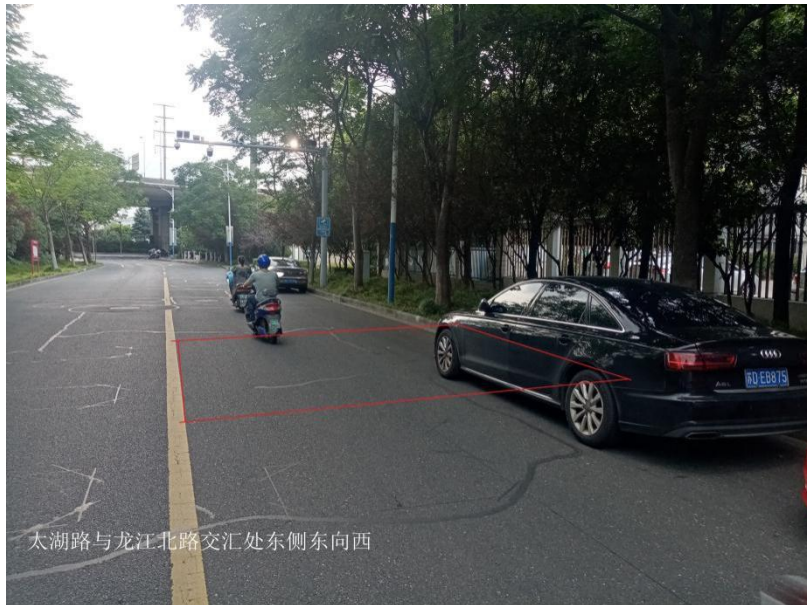
图 1-1 太湖路与龙江北路交汇处东侧东向西机动车道及非机动车道抓拍区域